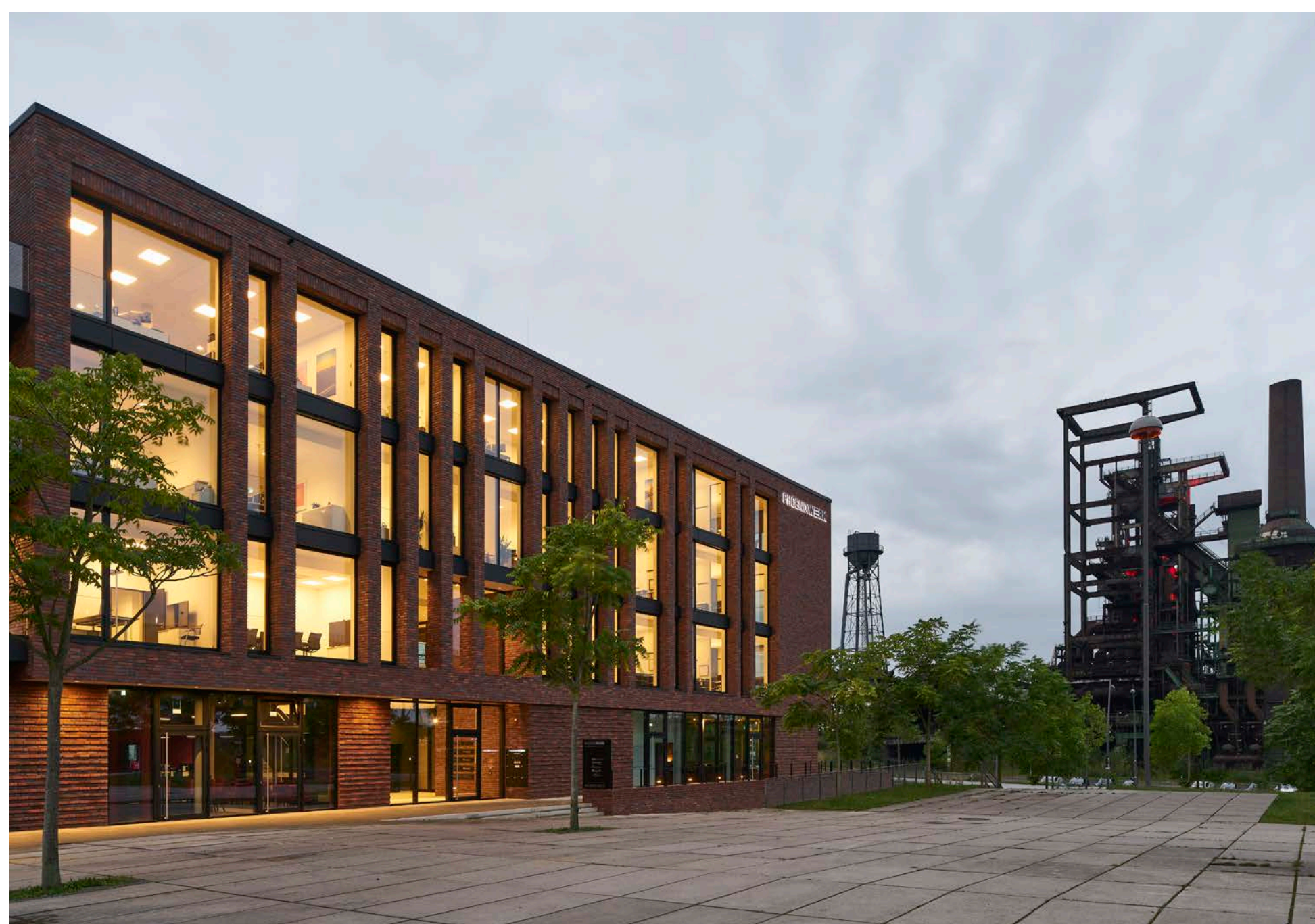
südliche Platzkante des Phoenixplatzes